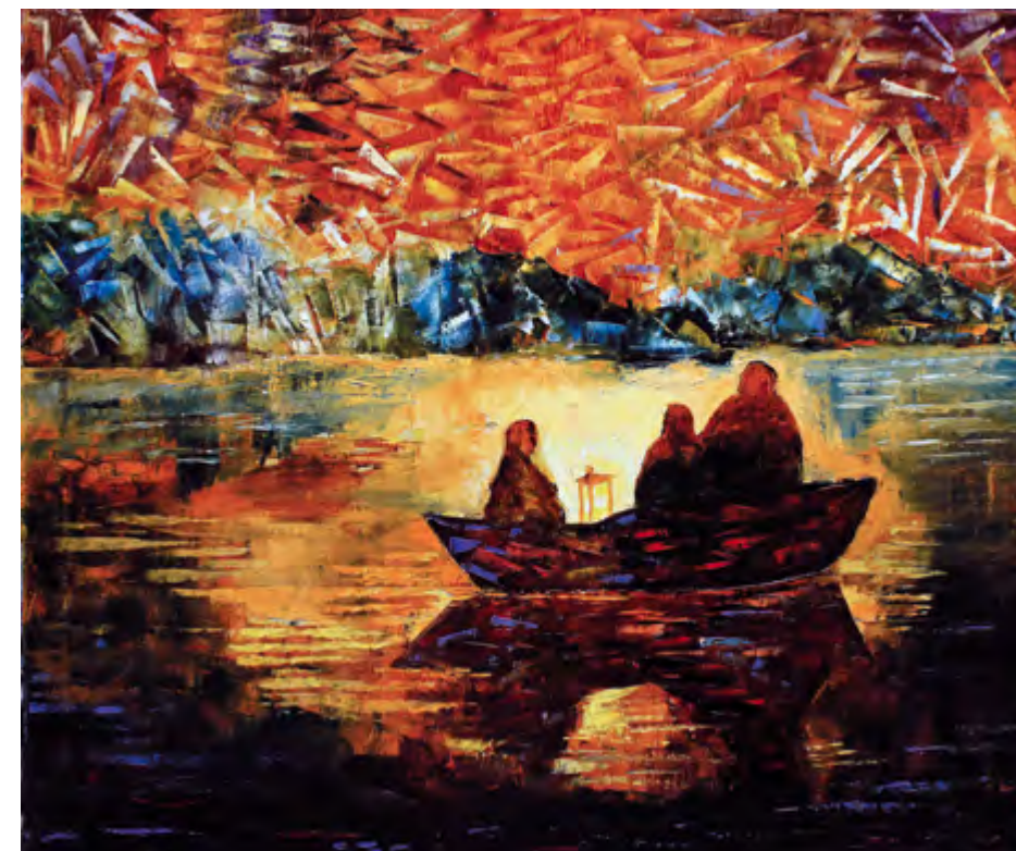
Звездопад. 2012 Холст, масло. 50x60