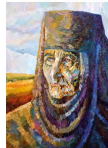
Монахиня. 2013 Холст, масло. 80x60