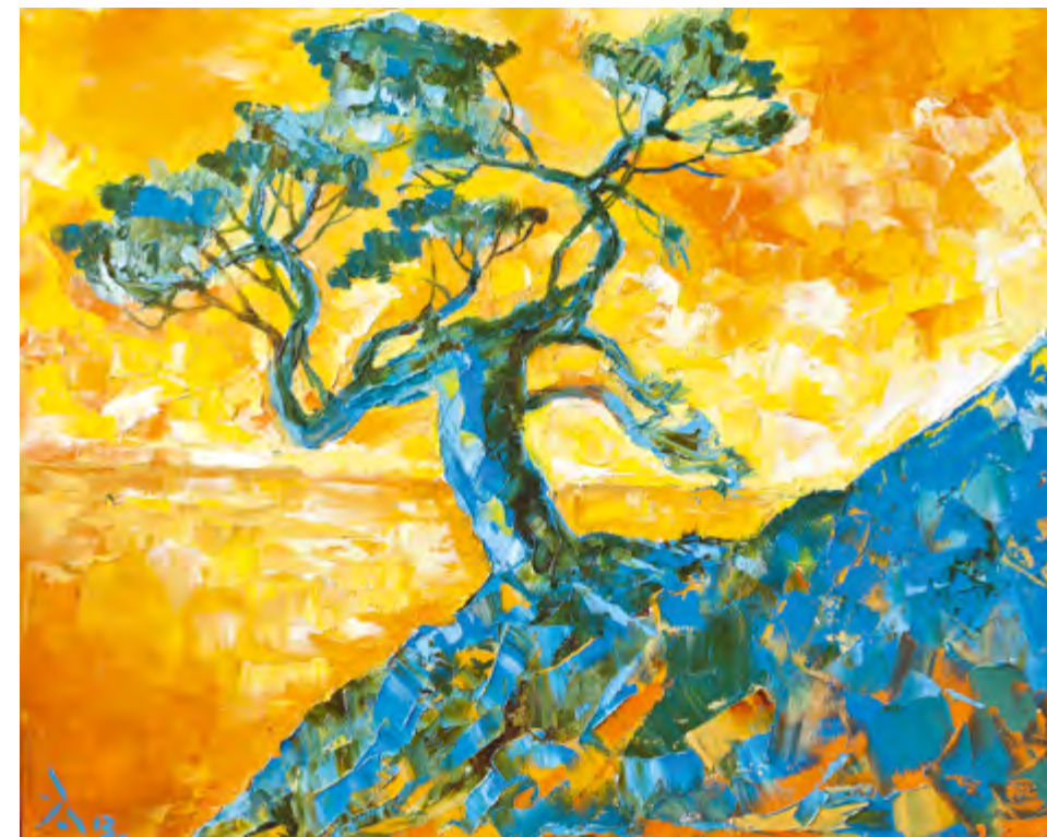
Оранжевый рассвет. 2013 Холст, масло. 40x50