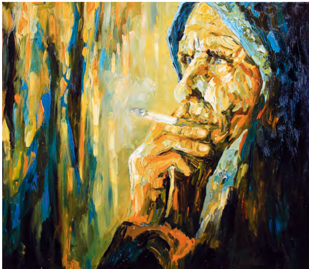
Она знает. 2012 Холст, масло. 60x70

Отмоли меня У меня самой В небо хочется Но мешает боль За молитвою Вижу чью-то тень В тихом омуте Серая метель