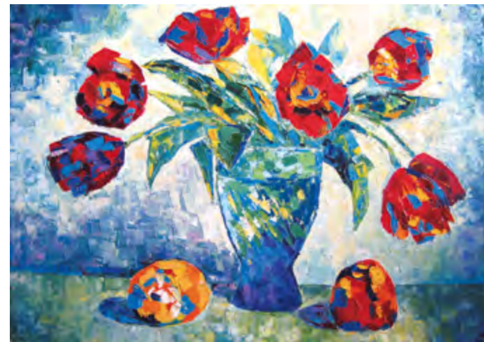
Тюльпаны. 2009 Холст, масло. 70x100