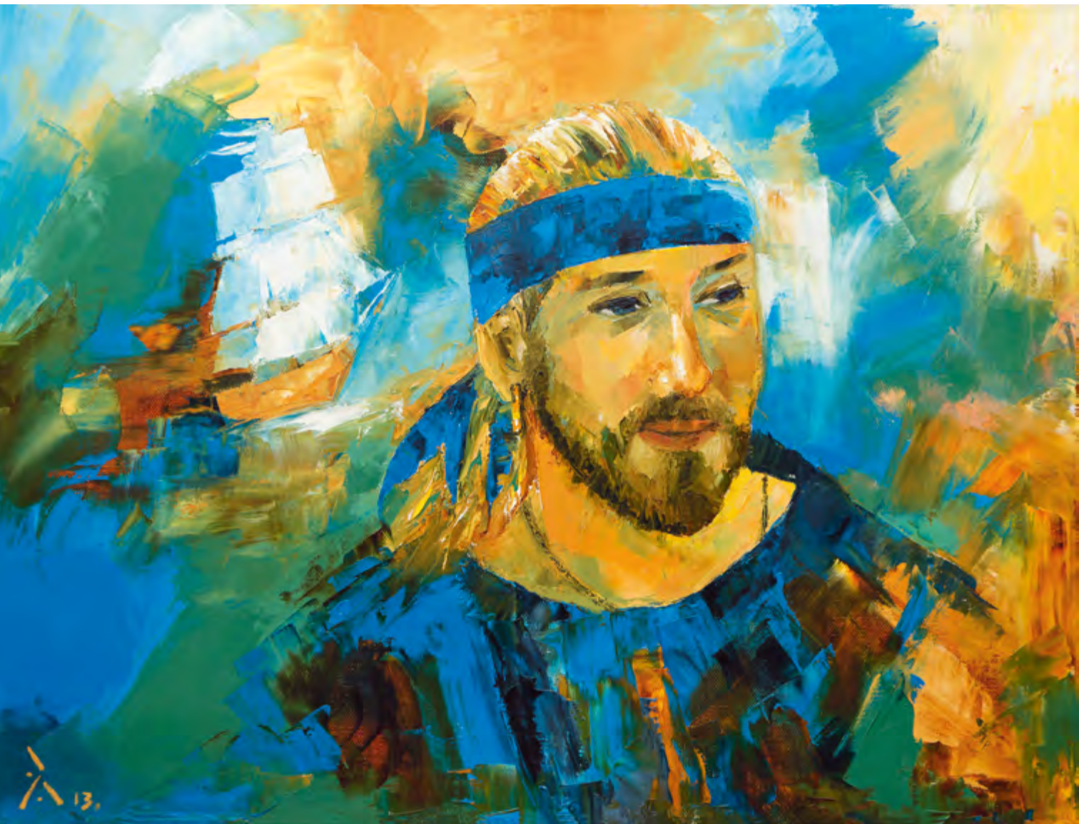
Ветер на воде Поет о счастье Разбивая корабли...