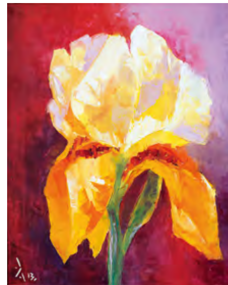
Серия «Ирисы». Солнце. 2013 Холст, масло. 50x40