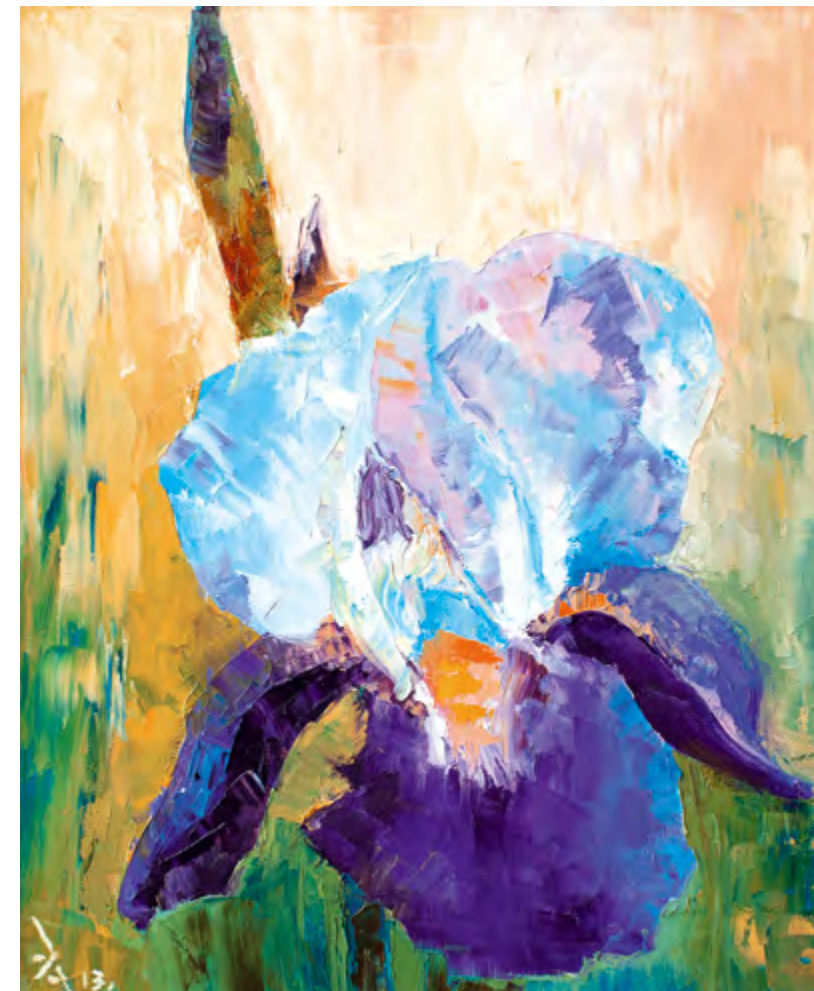
Серия «Ирисы». В саду. 2013 Холст, масло. 50x40

Быть может эта Тоненькая трель Мир сделает добрее?..