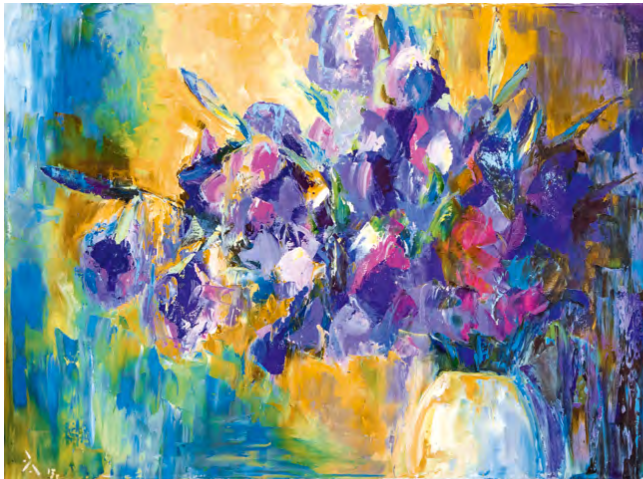
Магия сиреневого. 2013 Холст, масло. 60x80