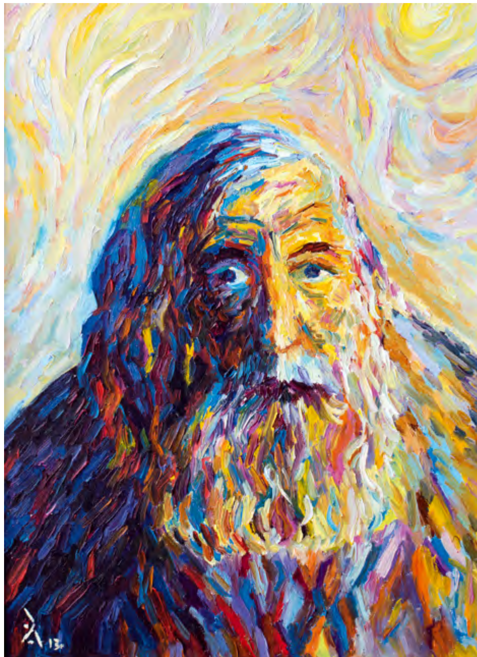
Великий Невидимый Разделил с тобой Способность творить...